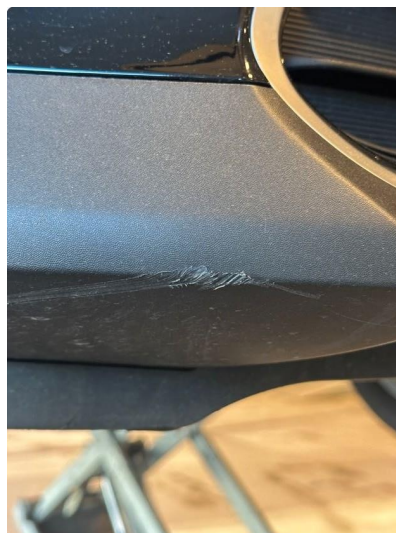
1.2 Noe oppriper på underside av fanger foran