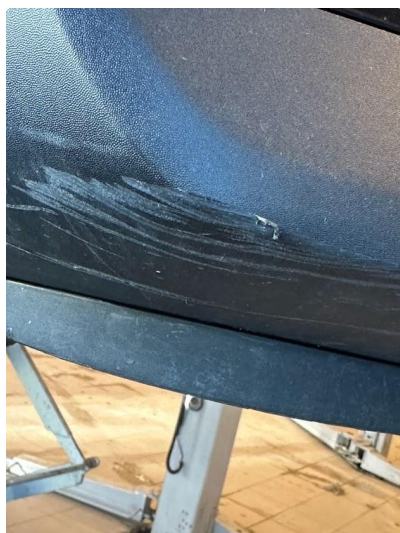
1.2 Noe oppriper på underside av fanger foran