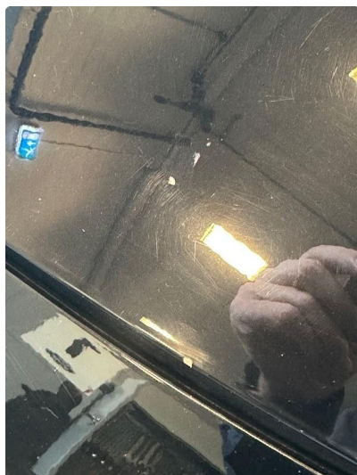
1.1 Noen små steinsprut i panser.