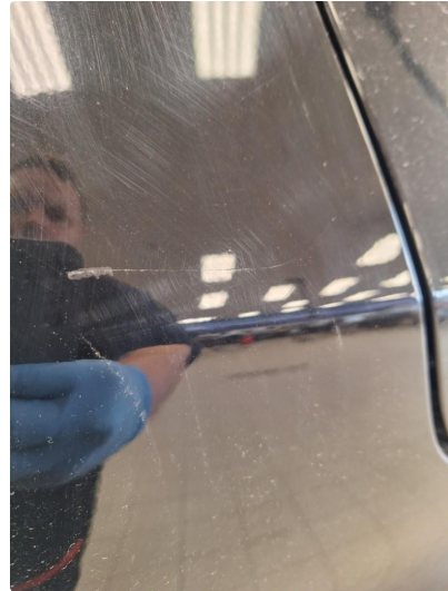
1.2 Ripe(r) ned til grunning