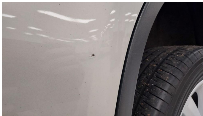
1.3 Lita ripe ned til grunning i dør venstre bak