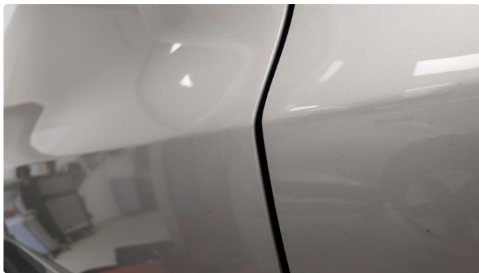
1.2 Små svake bulker i dør venstre foran