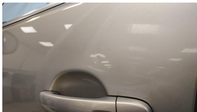
1.2 Små svake bulker i dør venstre foran