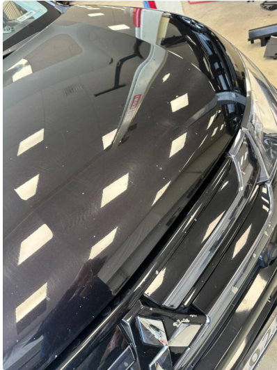
1.1 Noen steinsprut i panser