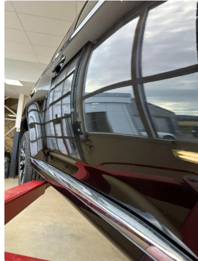
1.2 Noen små p-bulker i begge dører foran