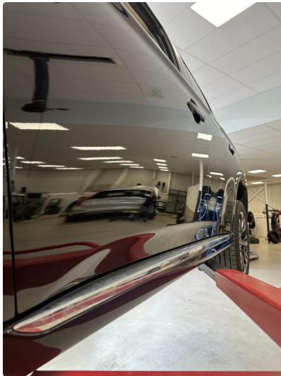
1.2 Noen små p-bulker i begge dører foran