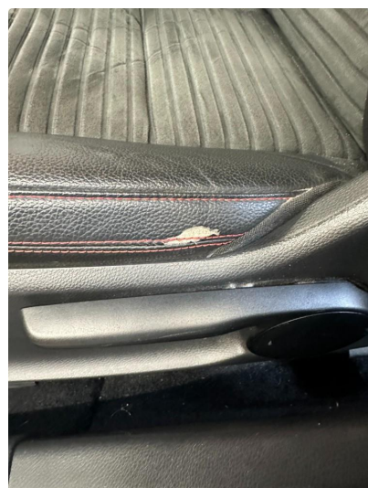
2.1 Liten skade førerstol.