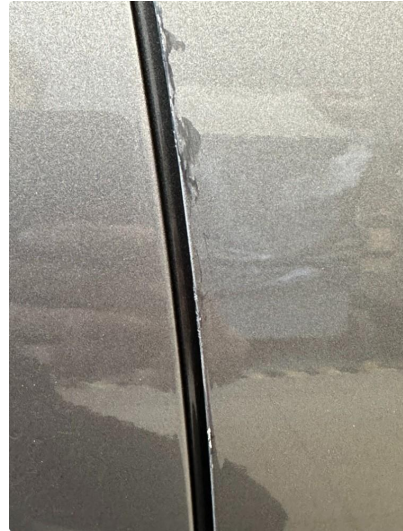
1.2 Små riper bakkant framdører.