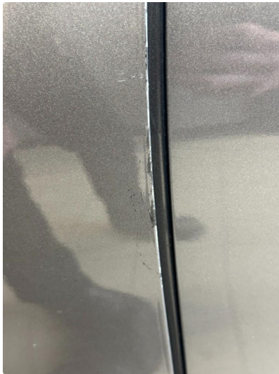
1.2 Små riper bakkant framdører.