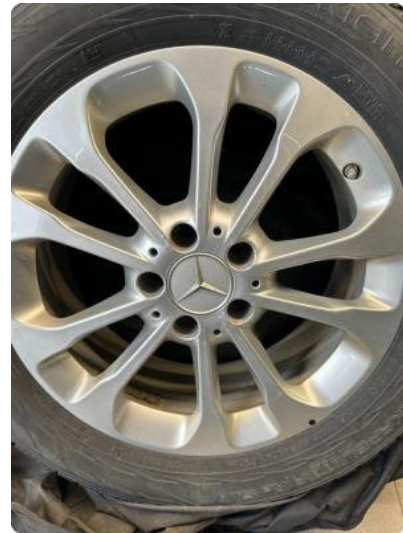
1.3 Noe oksidering felger.