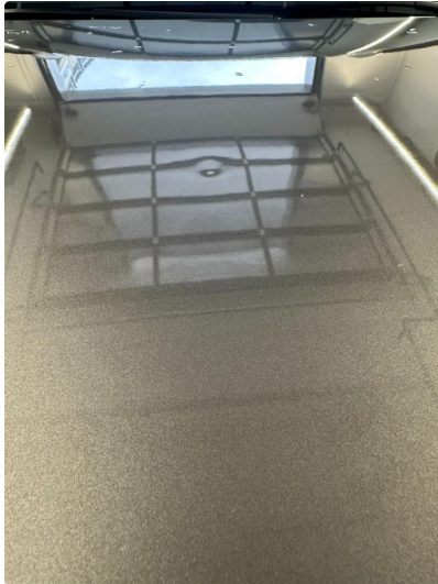
1.1 Liten bulk panser.