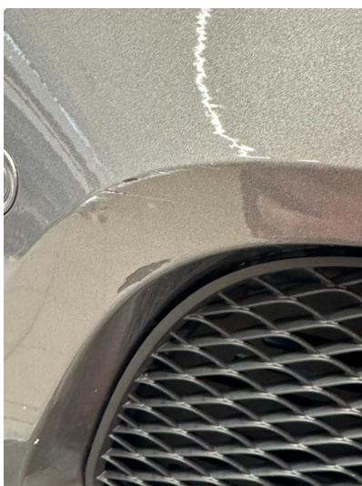
1.4 Små riper støtfanger foran.