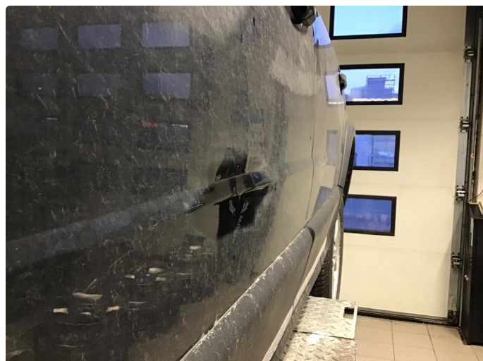
1.1 Noen riper og småbulker