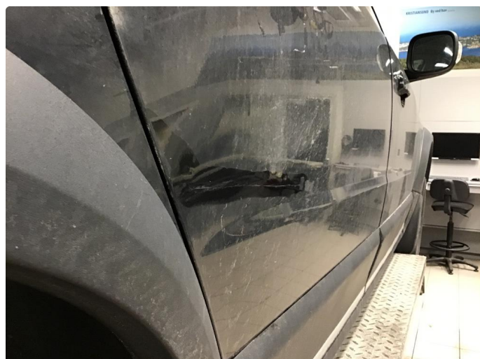
1.2 Noen bulker med lakkskader