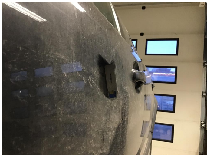
1.1 Noen riper og småbulker