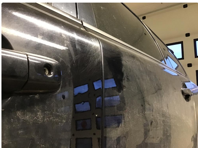
1.1 Noen riper og småbulker