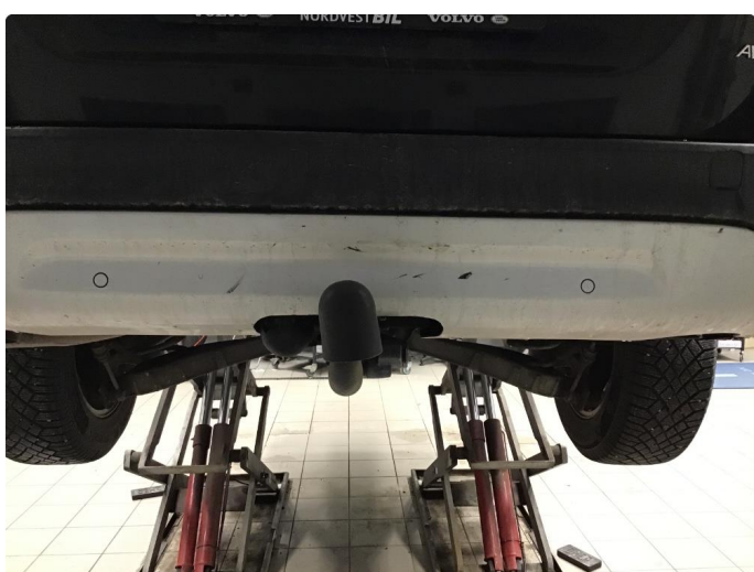
1.3 Noen riper