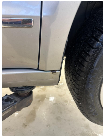
1.5 Steinsprut i kanal høyre foran