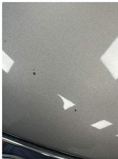
1.1 Noen steinsprut i panser. Normal slitasje