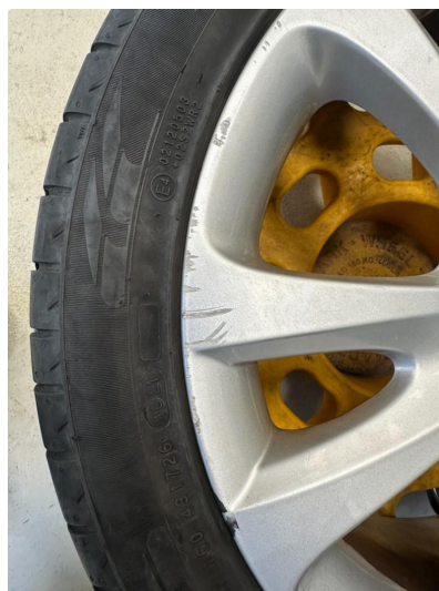
1.3 3 sommerfelger litt kantkjørt