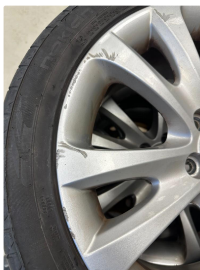
1.3 3 sommerfelger litt kantkjørt