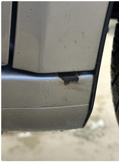
1.5 Steinsprut i kanal høyre foran