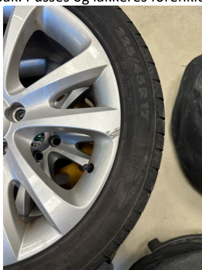
1.3 3 sommerfelger litt kantkjørt