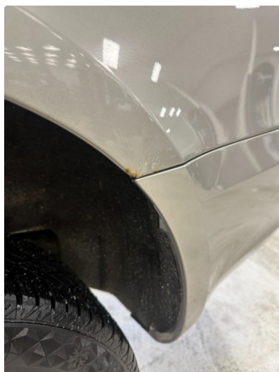
1.2 Liten antydning til rustdannelse i skjerm venstre bak. Pusses og lakkeres forenklet