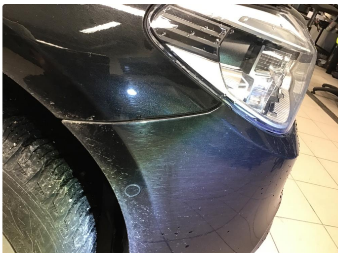
1.1 Små bruksmerker/riper