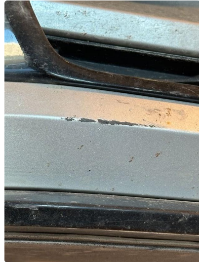
1.2 Litt oppripet på nedre del av fanger høyre foran