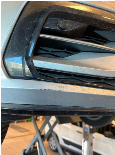
1.2 Litt oppripet på nedre del av fanger høyre foran