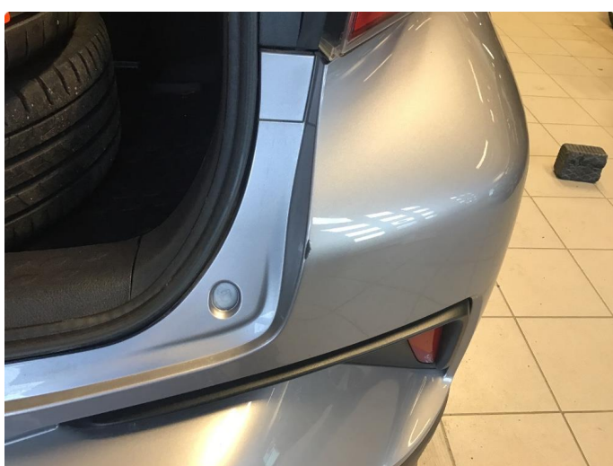
1.5 Lite hakk i støtfanger høyre bak.