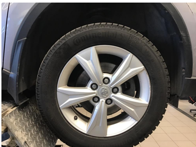
1.3 Liten kantkjøring