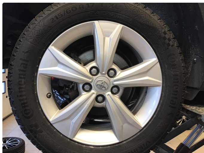
1.4 Liten kantkjøring