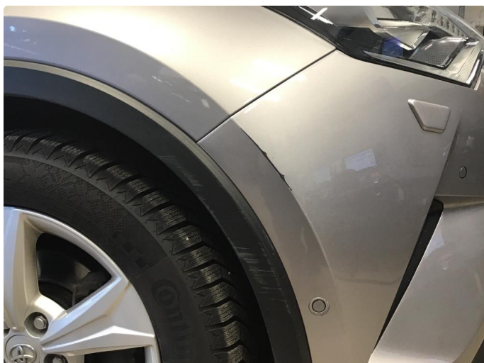
1.1 Ripe høyre framskjerm. Penslet over