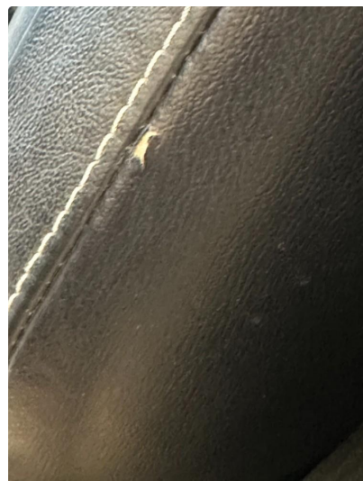
2.1 Lite rift i seterygg venstre foran