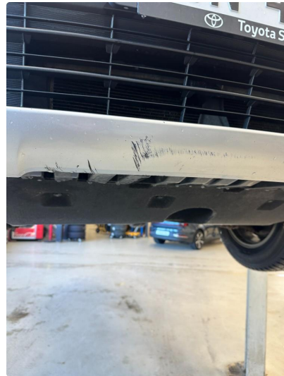
1.3 Litt oppripet på underside av fanger foran