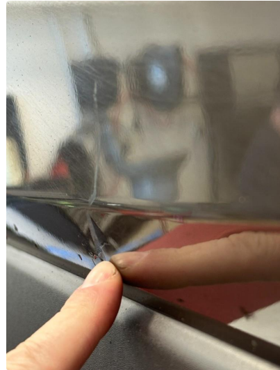
1.1 Lite p-bulk i dør venstre foran