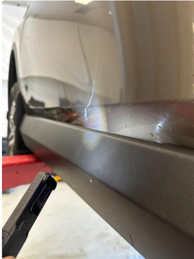
1.1 Lite p-bulk i dør venstre foran