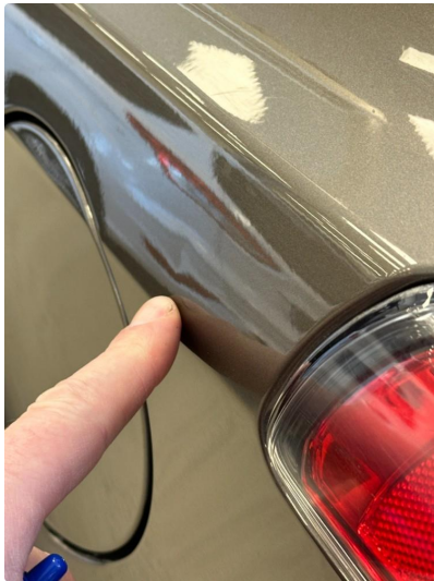
1.2 Liten p-bulk på skjerm venstre bak