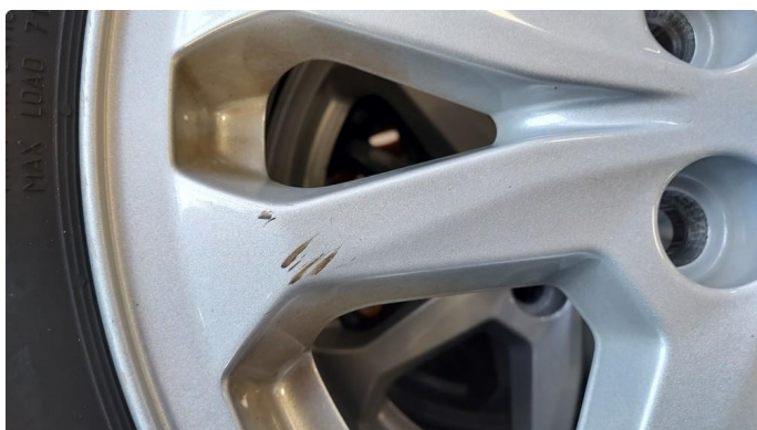
1.3 En vinterfelg litt kantkjørt