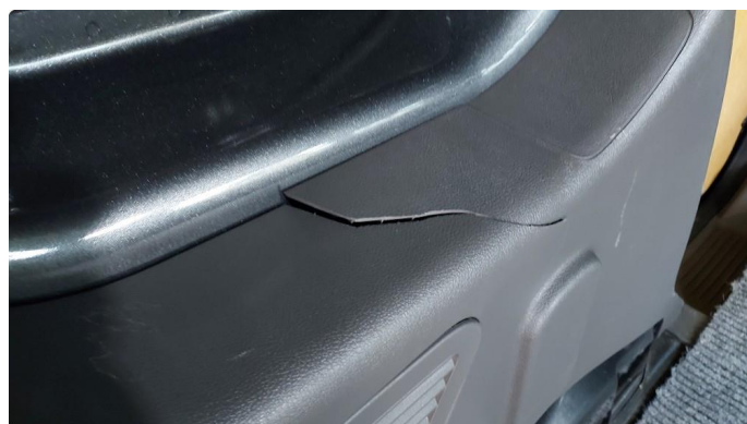
2.1 Sprekk i deksel venstre side varerom