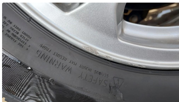
1.2 En sommerfelg litt kantkjørt