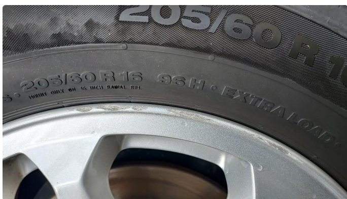
1.2 En sommerfelg litt kantkjørt