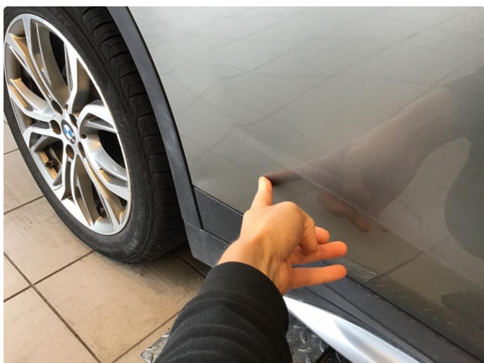
1.1 Flere parkeringsbulker rundt bilen