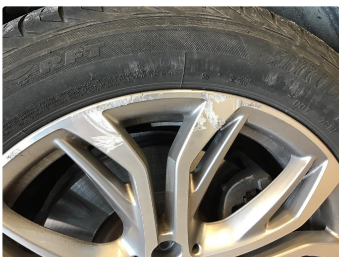
1.2 To kantkjørte felger