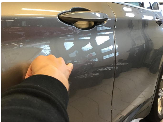
1.1 Flere parkeringsbulker rundt bilen