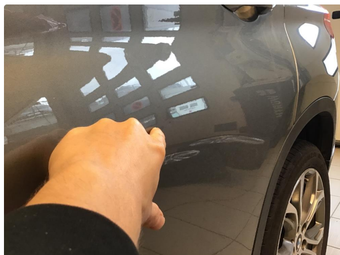
1.1 Flere parkeringsbulker rundt bilen