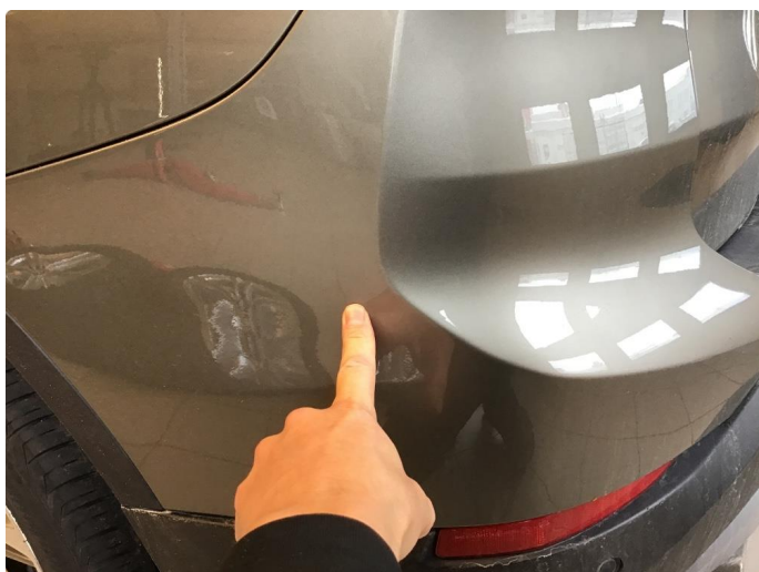
1.4 Skrubbskader underkant