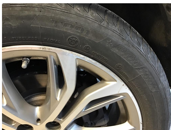
1.2 To kantkjørte felger