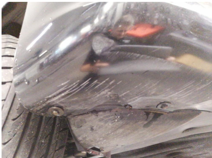
1.1 Skrubbskader underkant