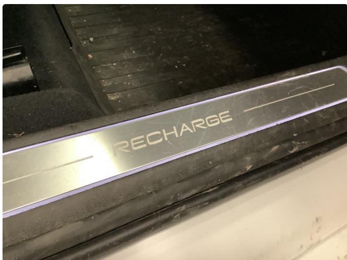
1.1 Noen riper i innsteg