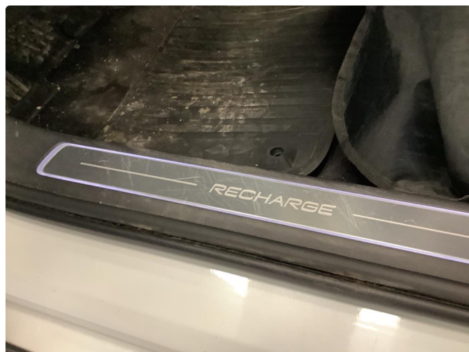
1.1 Noen riper i innsteg