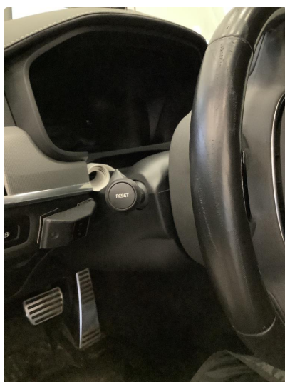
2.1 Noen bruksmerker på ratt.