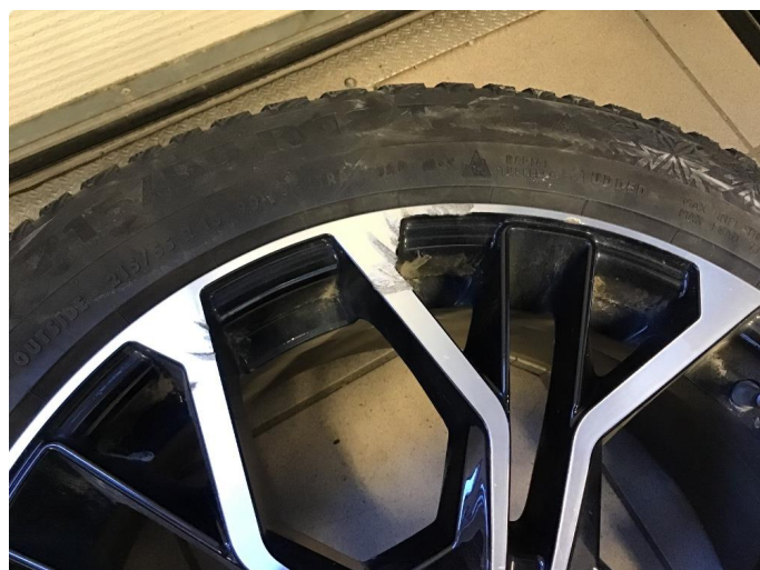
1.3 Liten kantkjøring HF