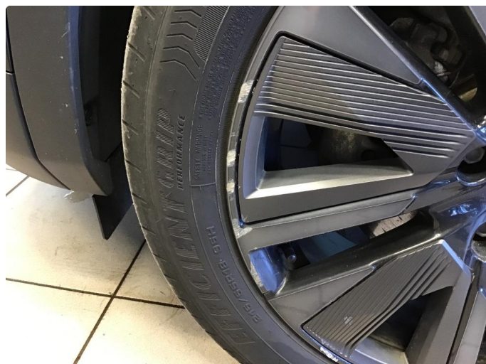
1.2 Liten kantkjøring VF