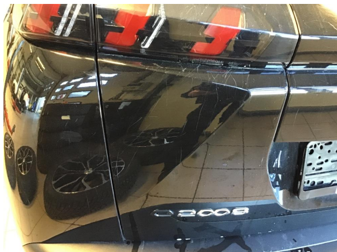
1.1 Små riper til venstre på bakluke