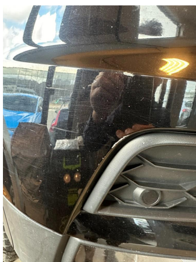
1.2 Noen riper i fanger foran