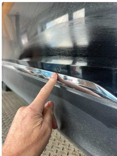
1.1 Noen små p-bulker i dør høyre foran