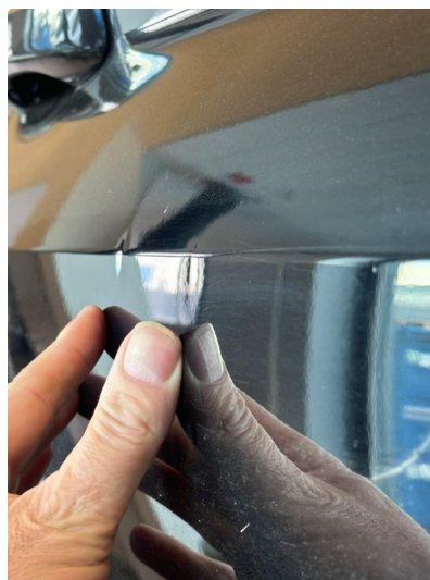
1.1 Noen små p-bulker i dør høyre foran