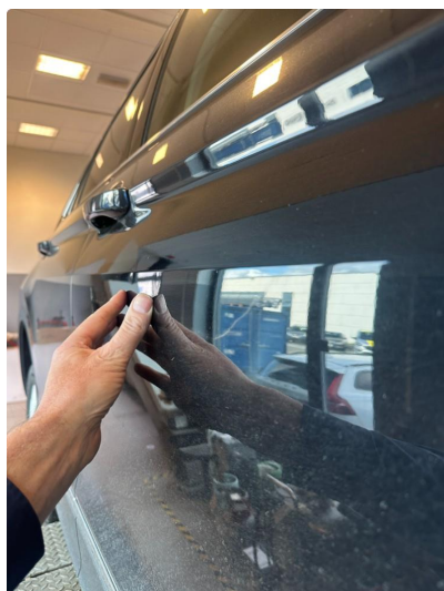
1.1 Noen små p-bulker i dør høyre foran