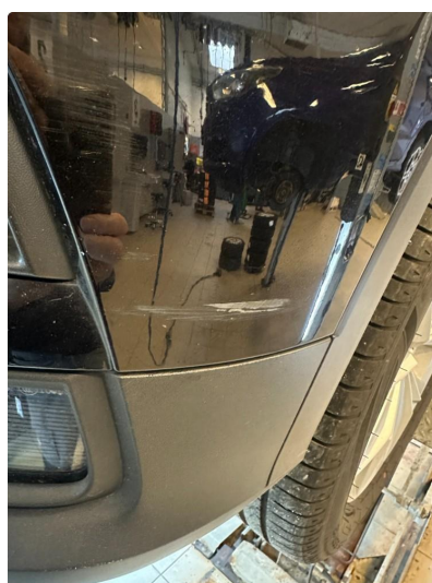
1.2 Noen riper i fanger foran