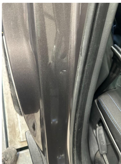
1.6 2 små bulker døråpning begge sider bak.