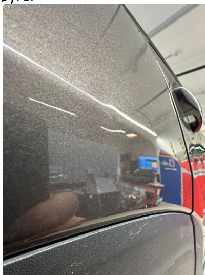
1.4 Liten bulk hjulbue høyre baksjerm.