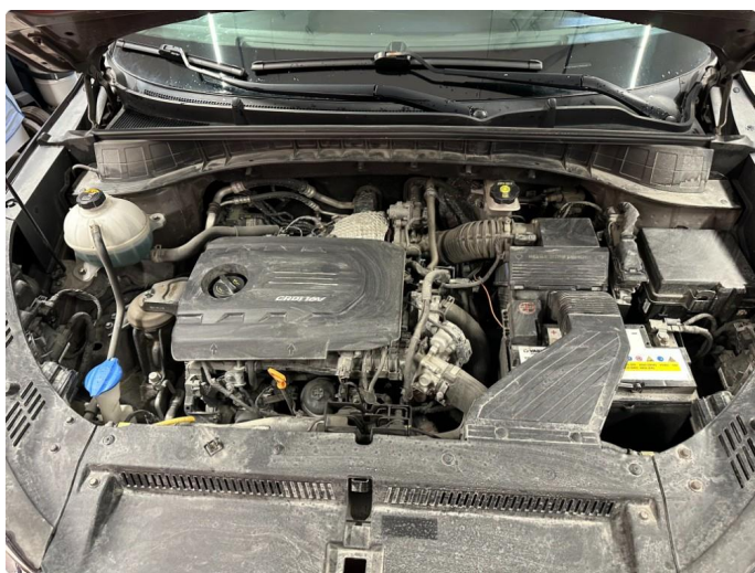
2.1 Litt svetteing toppdeksel.