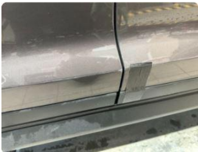
1.1 Ripe og løs pyntelist dører høyre. Liten bulk bakdør høyre.