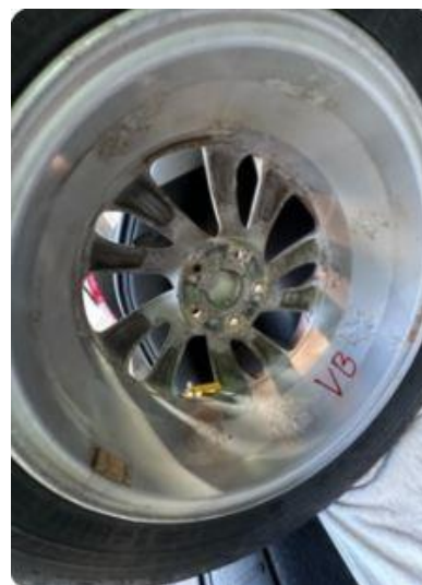
1.5 Oksidering vinterfelger .