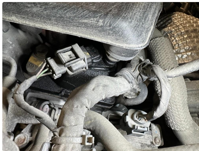
2.1 Litt svetteing toppdeksel.