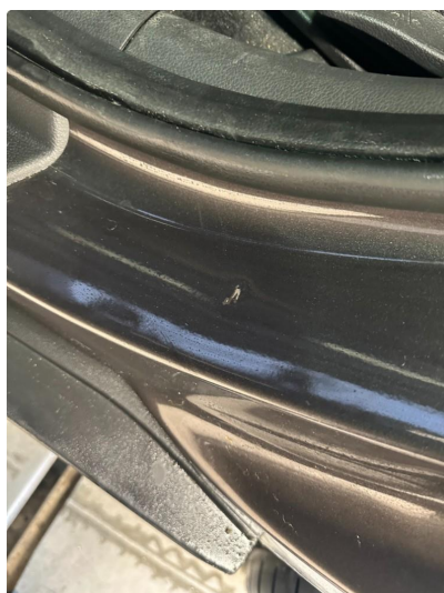
1.6 2 små bulker døråpning begge sider bak.