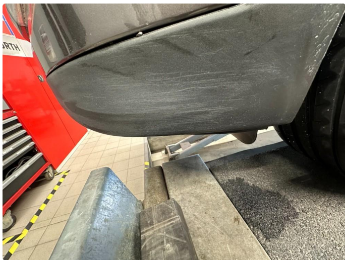
1.7 Skrubbskader støtfangerhjørne venstre foran.