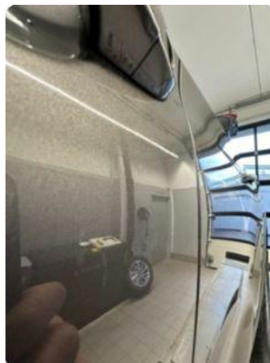
1.2 Flere minibulker førerdør. Noen riper.