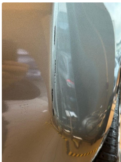
1.1 Noen ripe(r) i fanger høyre bak