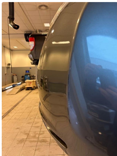
1.1 Noen ripe(r) i fanger høyre bak