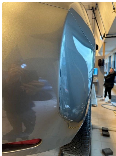
1.1 Noen ripe(r) i fanger høyre bak