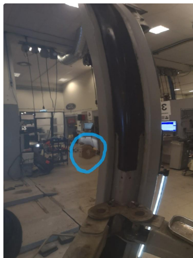
1.1 Liten bulk i dør høyre bak