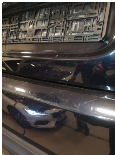
1.2 Noen riper i fanger bak