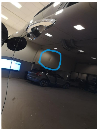
1.1 Liten bulk i dør høyre bak