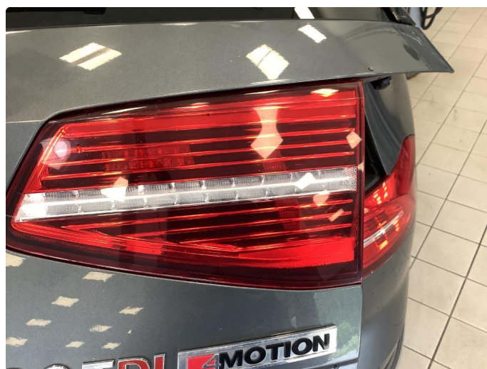
2.1 Litt dugg/fukt