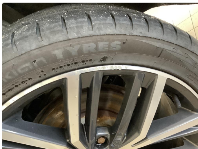
1.3 Liten skade på en felg