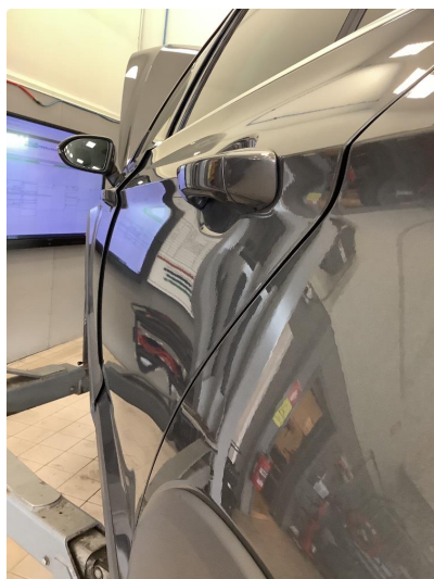
1.2 Liten p-bulk