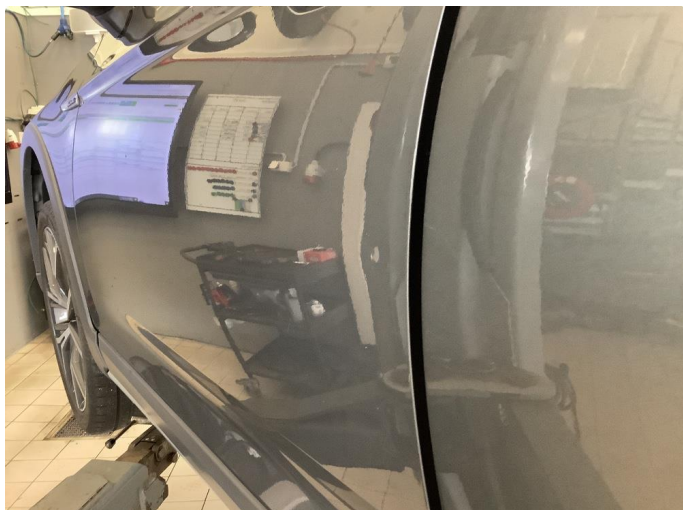
1.1 2 små p-bulker