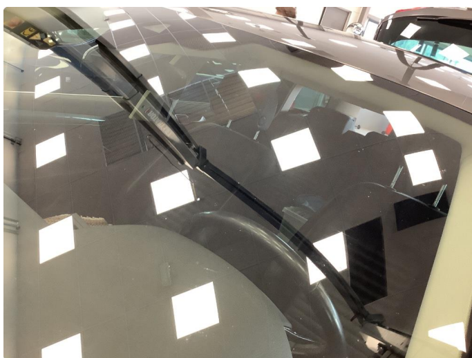
1.4 Litt slittasje