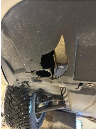
1.1 Noe oppripet/sprekker på underside av fanger foran