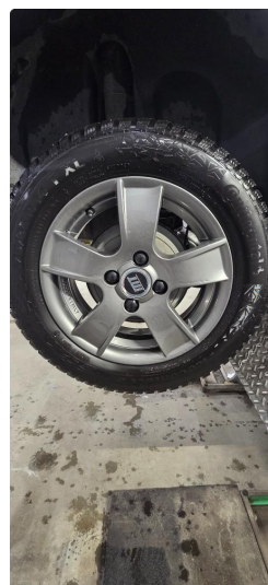
4.1 Øvrig opplysninger