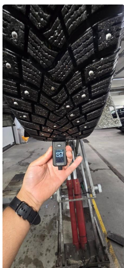
4.1 Øvrig opplysninger