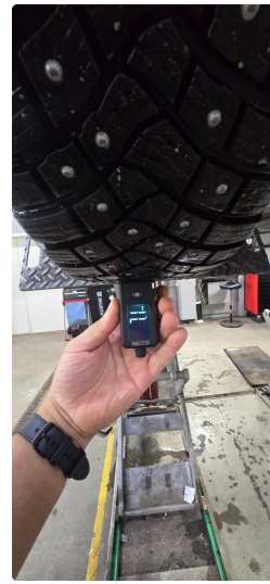
4.1 Øvrig opplysninger