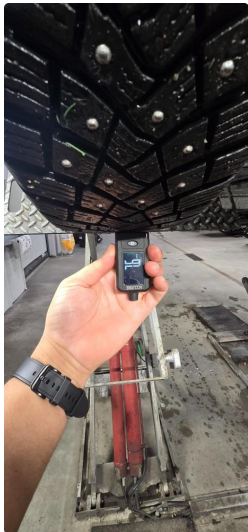
4.1 Øvrig opplysninger