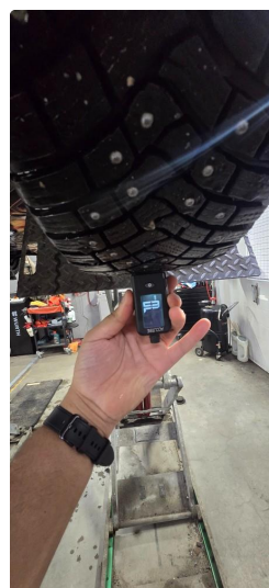
4.1 Øvrig opplysninger