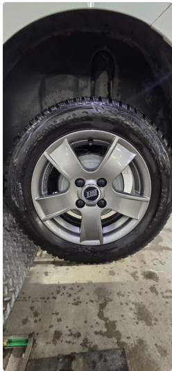
4.1 Øvrig opplysninger