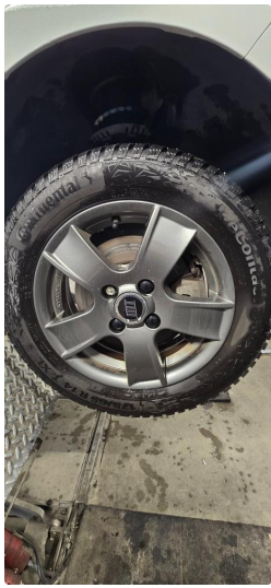
4.1 Øvrig opplysninger