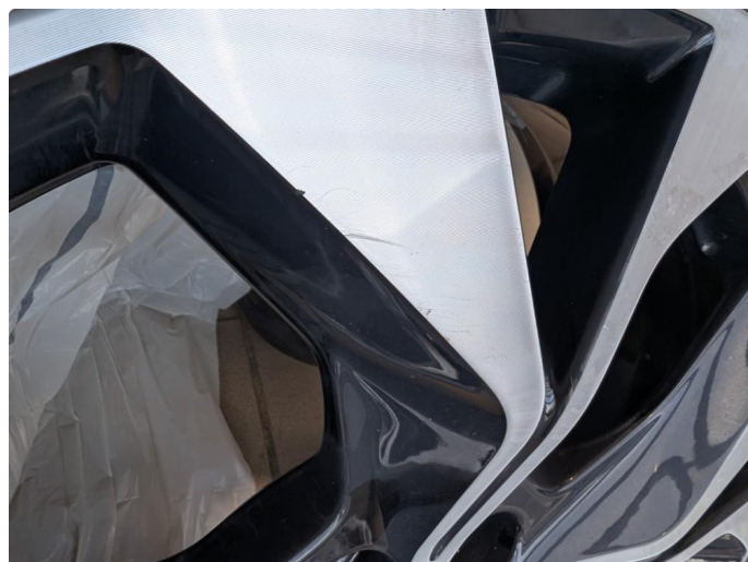
1.1 Ripe (r) gjennom lakk