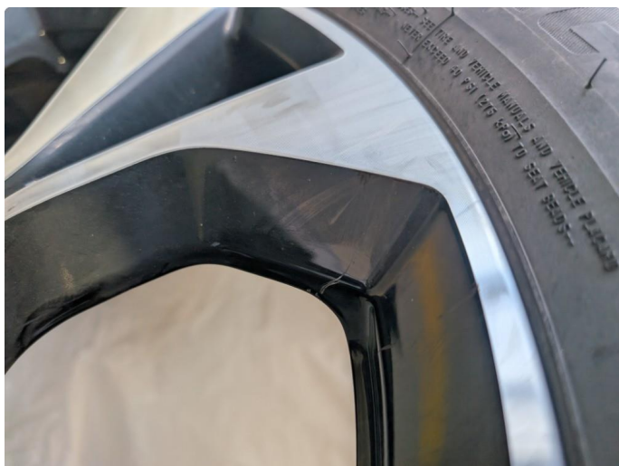
1.1 Ripe (r) gjennom lakk