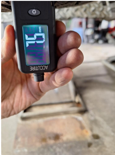
3.1 Øvrig opplysninger