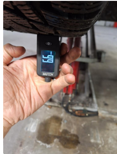
3.1 Øvrig opplysninger