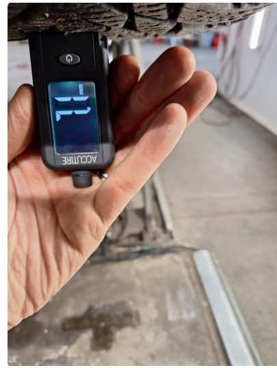
3.1 Øvrig opplysninger