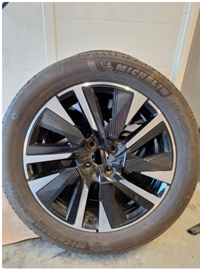
3.1 Øvrig opplysninger