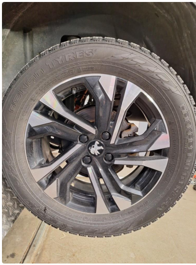
3.1 Øvrig opplysninger