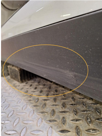
1.1 Øvrige feil