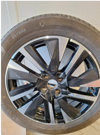
3.1 Øvrig opplysninger