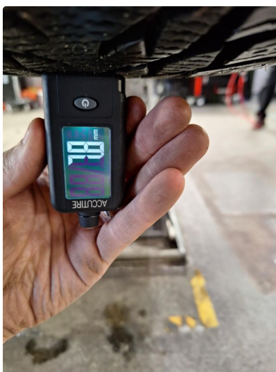
3.1 Øvrig opplysninger