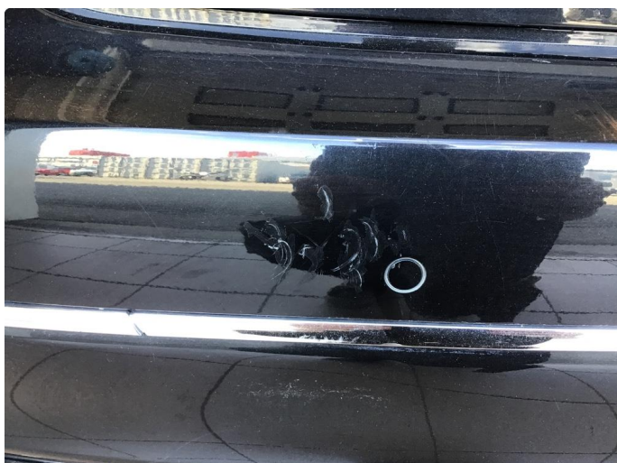
1.3 Riper på støtfanger