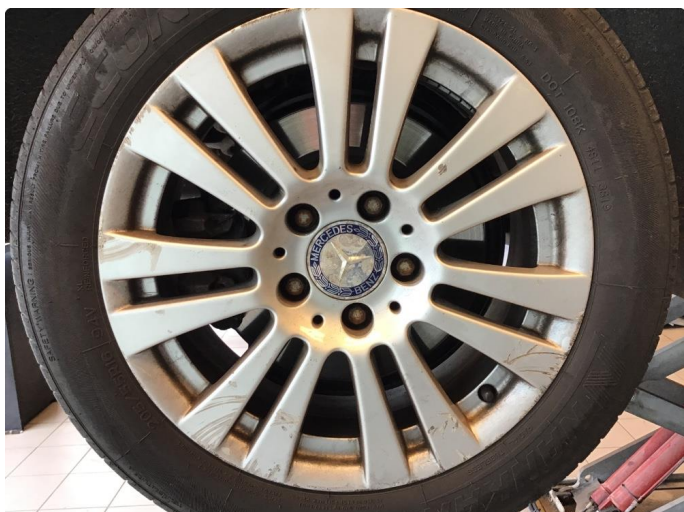
1.2 Skrammer høye felg bak