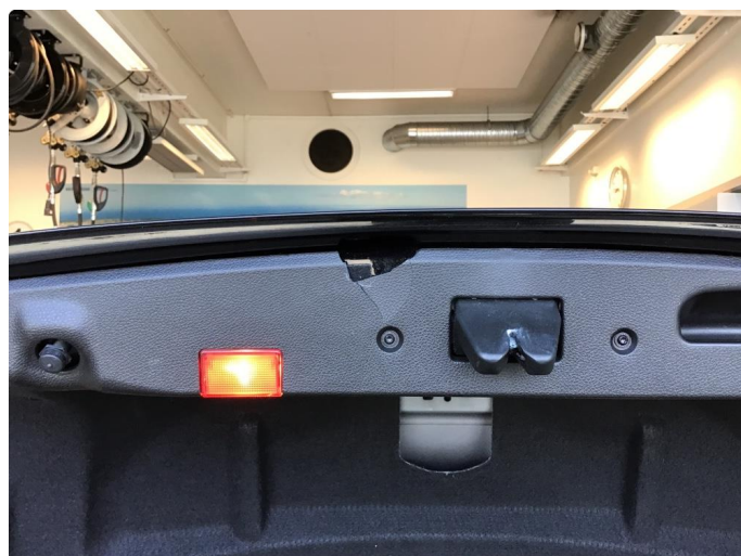
2.1 Skade på deksel bakluke