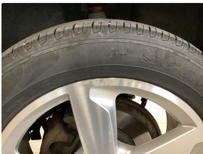
1.3 Påbegynnende oksidering