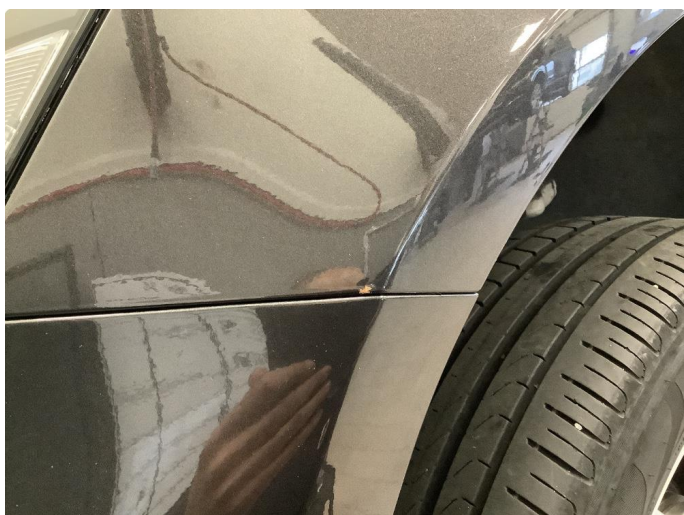
1.2 Noe steinsprut