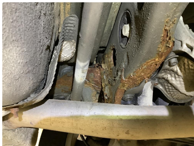
1.1 Øvrige feil