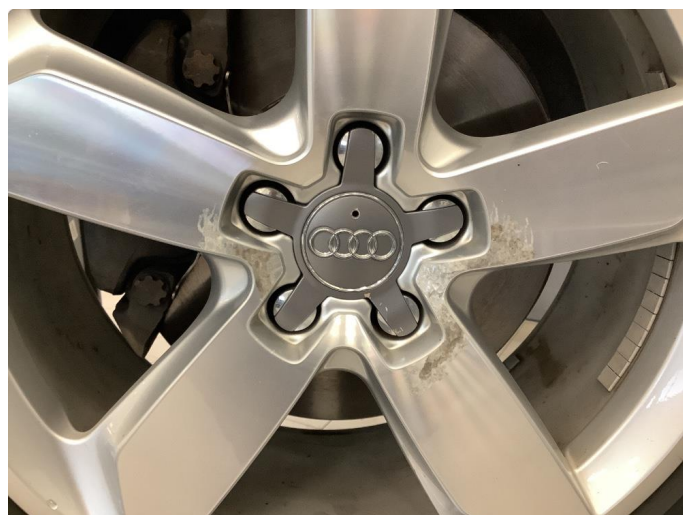
1.3 Påbegynnende oksidering