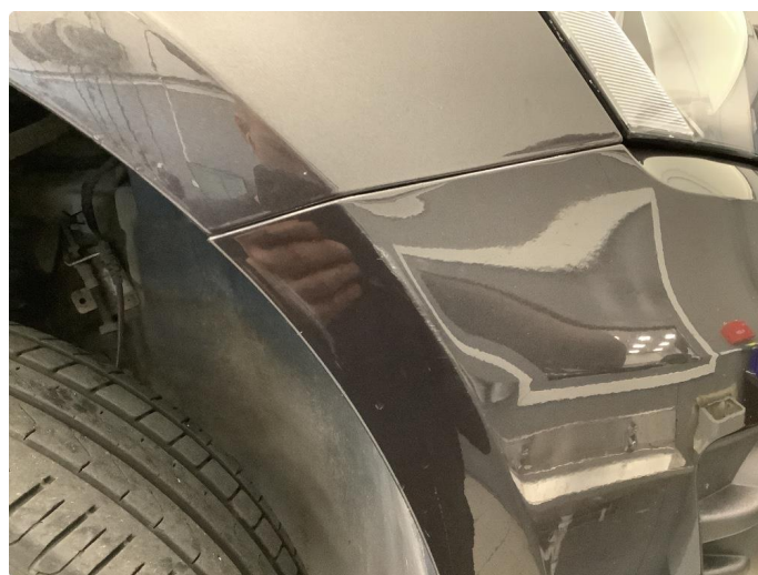
1.4 Skrb skade høyre støtfangerhjørne