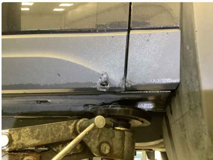
1.5 Noen bruksmerker