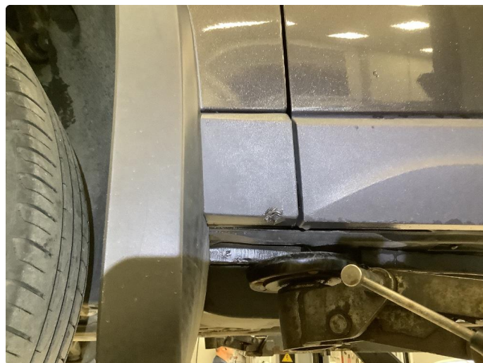
1.5 Noen bruksmerker