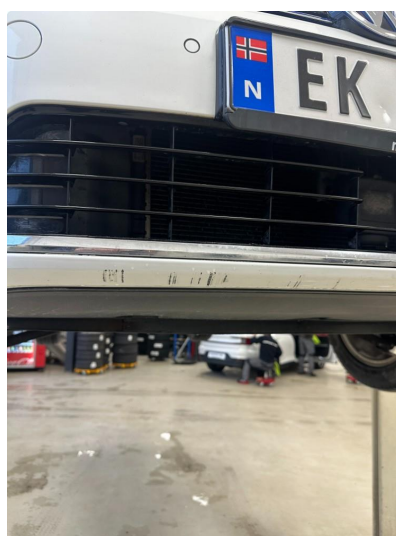
1.4 Litt oppripet på underside av fanger foran