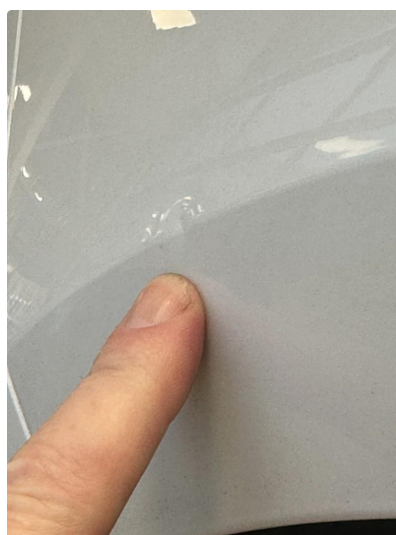
1.3 Liten p-bulk i skjerm høyre bak