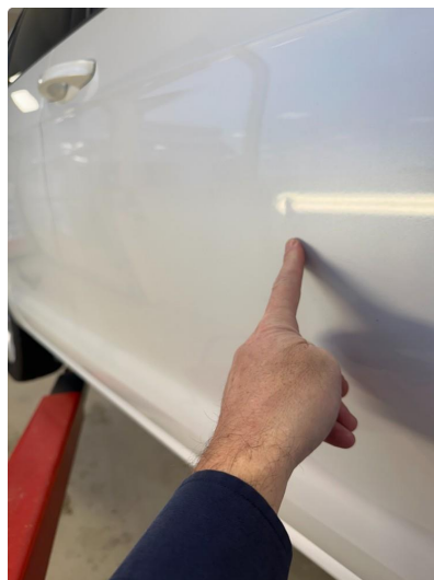
1.2 Bulk i dør høyre foran