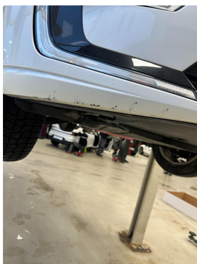
1.4 Litt oppripet på underside av fanger foran