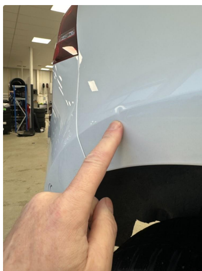
1.3 Liten p-bulk i skjerm høyre bak