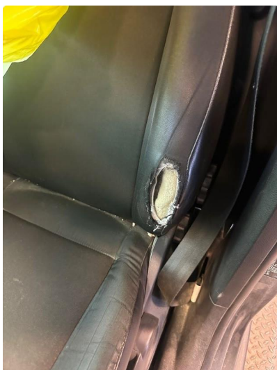
2.1 Uoriginalt setetrekk er lagt på sete.