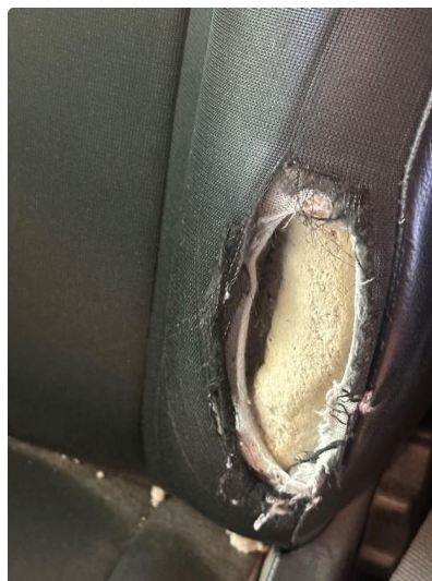
2.1 Uoriginalt setetrekk er lagt på sete.