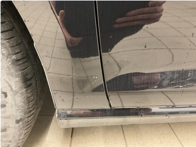
1.1 Lakk flasser