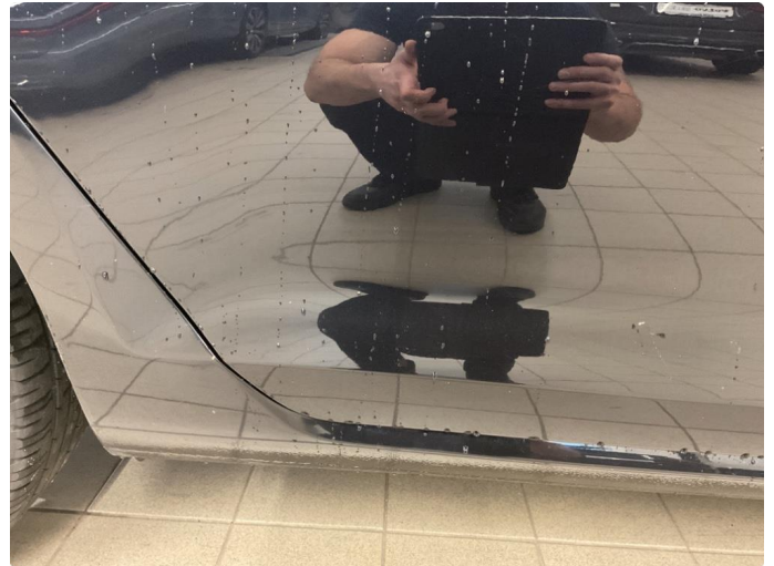
1.2 Noe korrosjon/rust