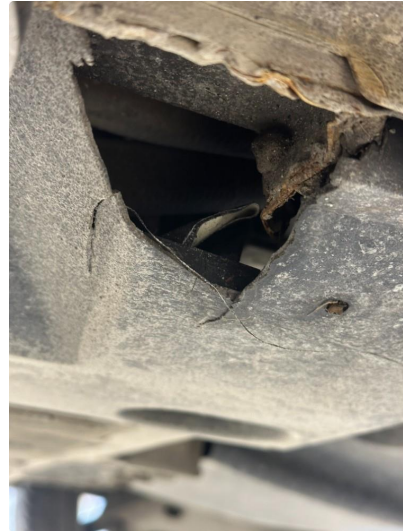
1.1 Beskyttelsesplate under bil har noe hull/sprekker.