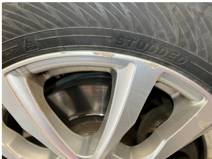
1.7 Riper i 2 vinterfelger.