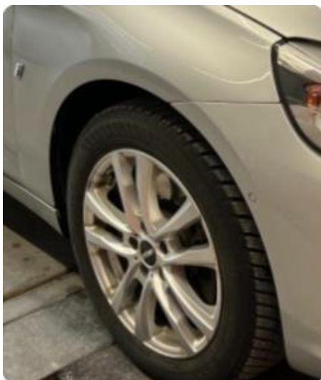
1.5 Steinsprut med rust hjulbue skjerm høyre foran.