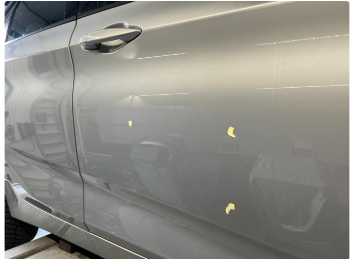
1.2 Flere bulker dør høyre foran.