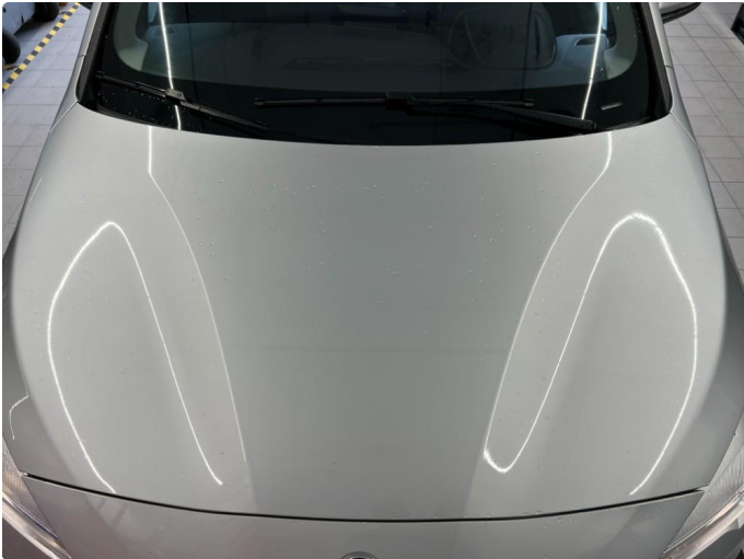
1.1 2 små bulker panser.