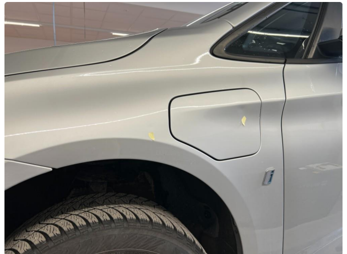
1.4 2 små bulker skjerm venstre foran.