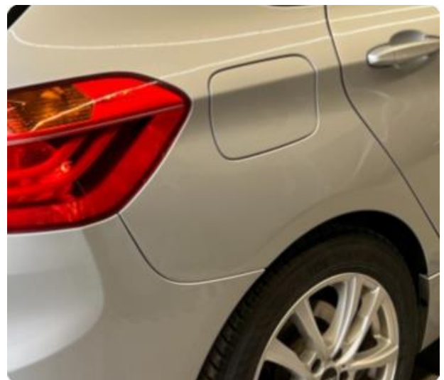
1.6 Minibulker skjerm høyre bak.