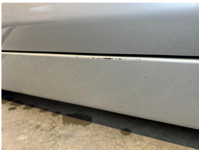
1.8 Ripe dørstokk venstre