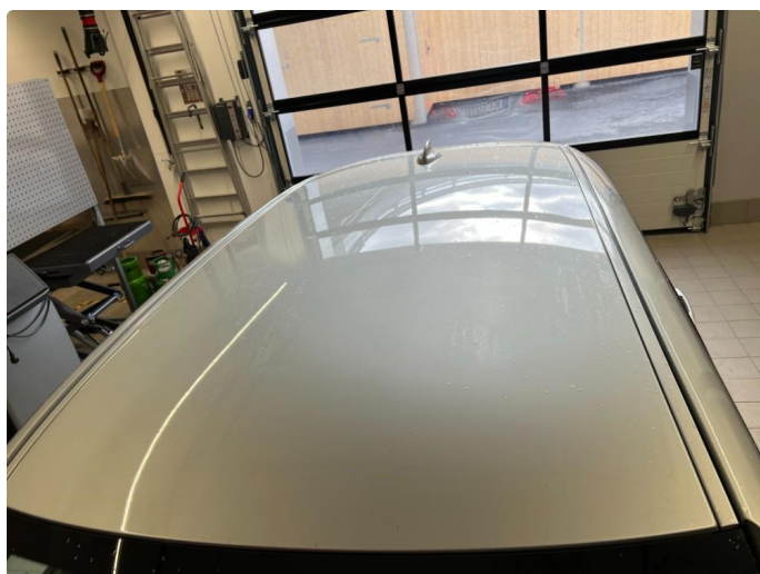
1.9 En bulk bakkant tak.