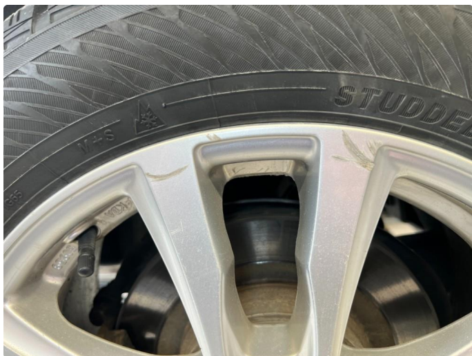
1.7 Riper i 2 vinterfelger.