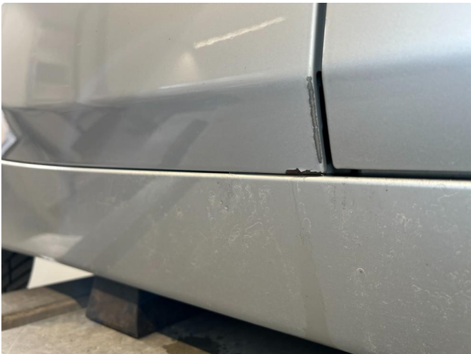
1.3 Rust/korrosjon bakkant nedre del dør venstre foran