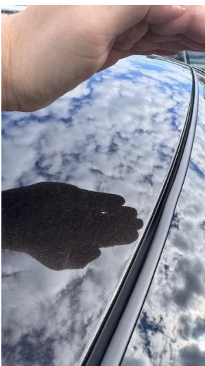
1.4 Steinsprut på tak med liten rustorm