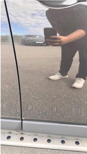
1.1 Liten ripe dør