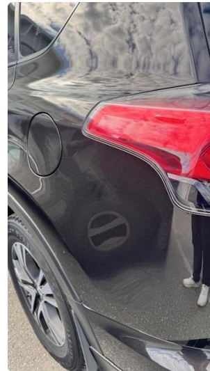
1.3 Tynne riper bak på begge sidder