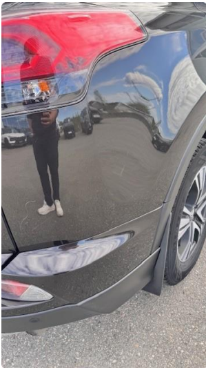
1.3 Tynne riper bak på begge sidder