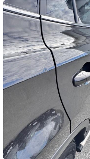
1.2 Liten bulk