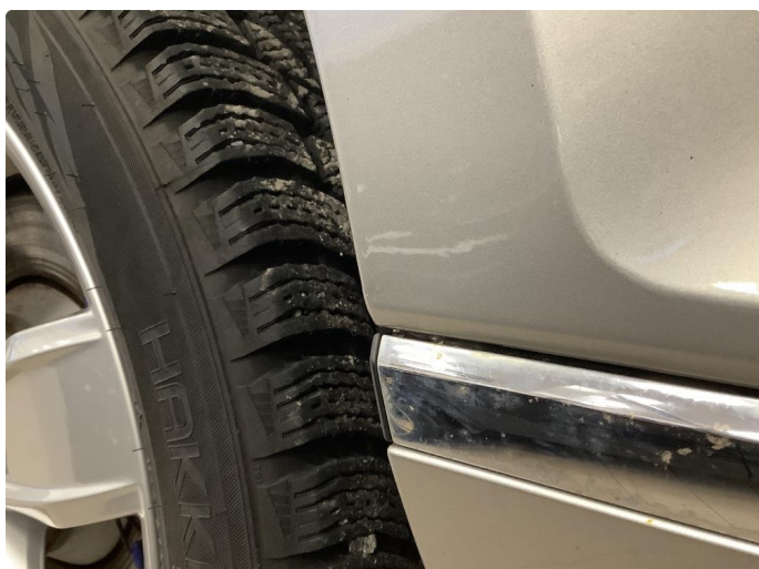
1.3 Steinsprut foran høyre bakhjul