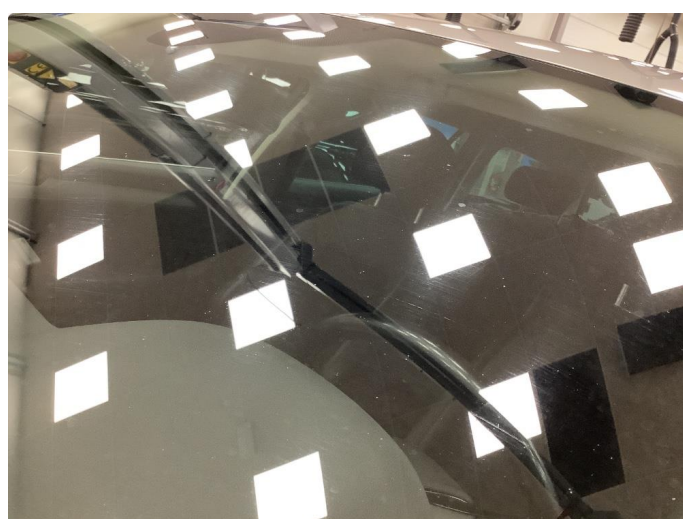
1.6 Noen striper