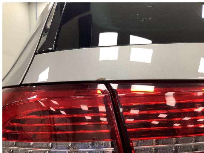
1.2 Liten lakkskade i nedre kant