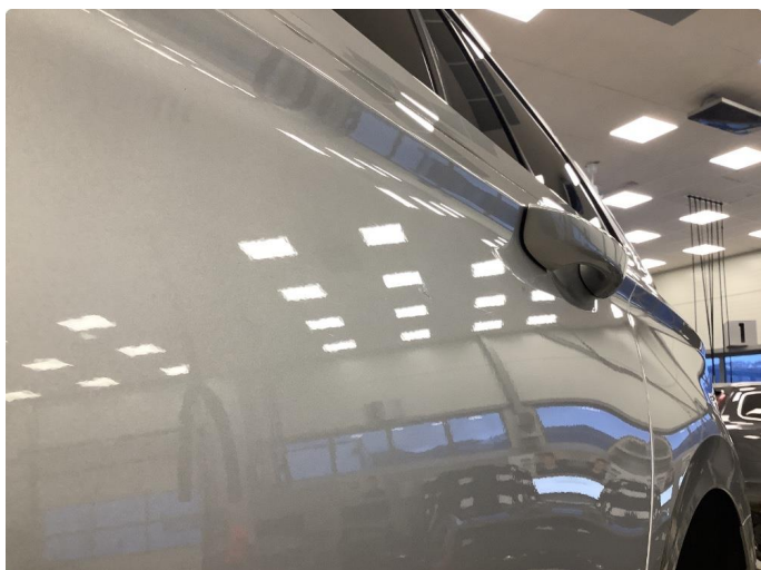
1.1 Liten bulk på venstre bakdør