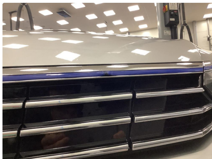
1.4 Liten skade på grill