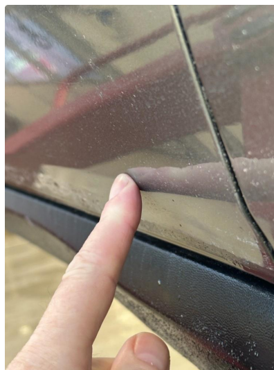
1.1 Liten p-bulk i dør høyre foran