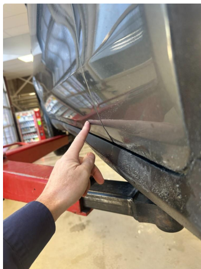
1.1 Liten p-bulk i dør høyre foran