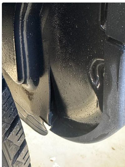
1.2 Liten sprek i plastinnerskjerm høyre foran