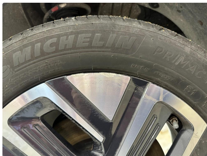
1.2 2 stk sommerfelger litt kantkjørt