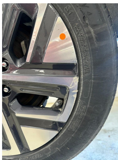
1.2 2 stk sommerfelger litt kantkjørt