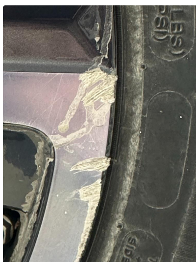
1.2 2 stk sommerfelger litt kantkjørt