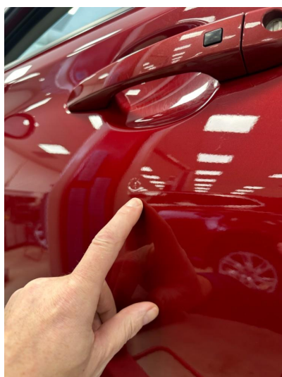
1.1 Liten p-bulk i dør venstre foran