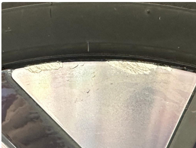
1.2 2 stk sommerfelger litt kantkjørt