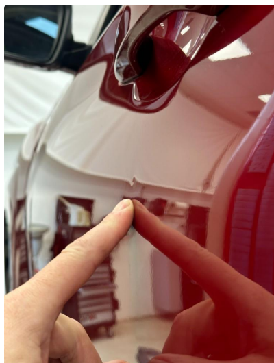
1.1 Liten p-bulk i dør venstre foran