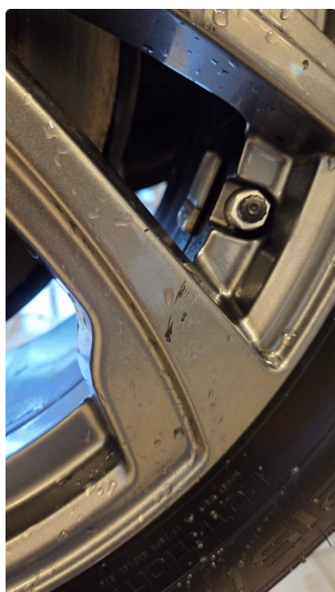
1.3 Noe kantkjørte vinterfelger venstre side foran og høyre side bak