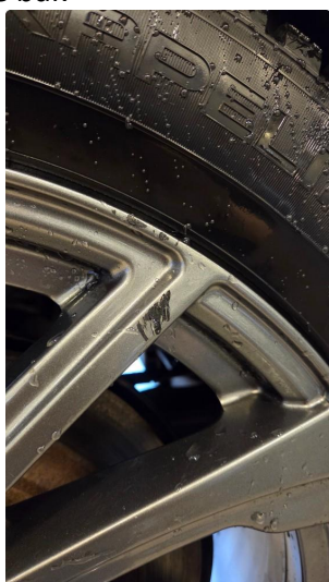
1.3 Noe kantkjørte vinterfelger venstre side foran og høyre side bak