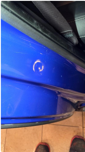
1.4 Noen riper og småbulker i dørkarmer