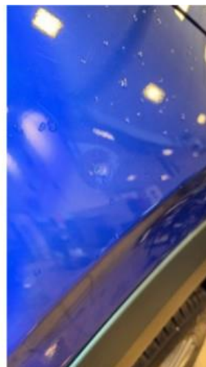
1.2 Liten bulk i høyre forskjerm