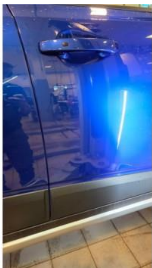
1.1 Små riper på høyre fordør