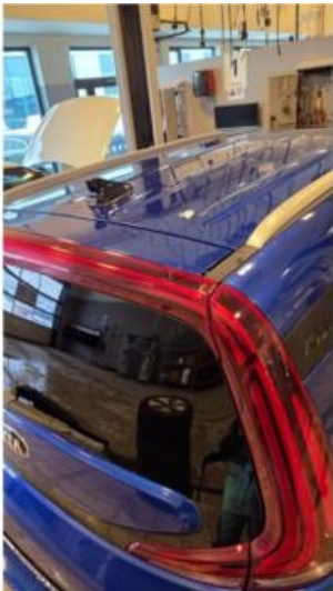
2.1 Liten ripe på toppen av baklykt