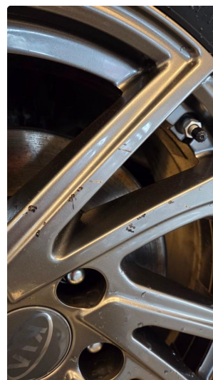
1.3 Noe kantkjørte vinterfelger venstre side foran og høyre side bak