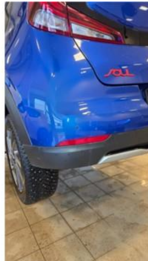
1.5 Noen riper på støtfanger bak