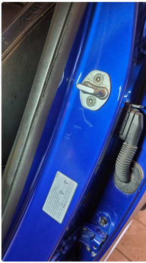
1.4 Noen riper og småbulker i dørkarmer