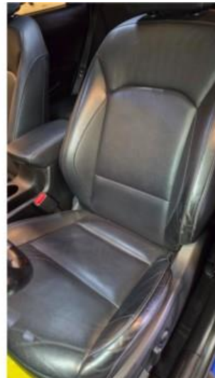
3.1 Noe bruksslitasje på førersetet