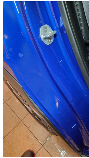
1.4 Noen riper og småbulker i dørkarmer