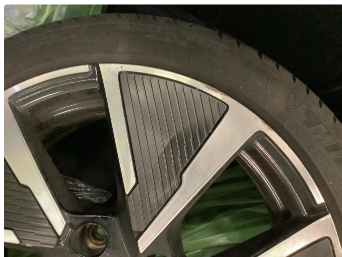
1.2 Noen bruksmerker på felg