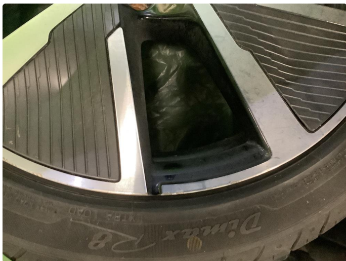
1.2 Noen bruksmerker på felg