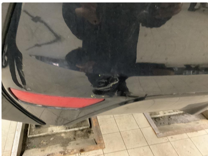
1.1 Liten ripe