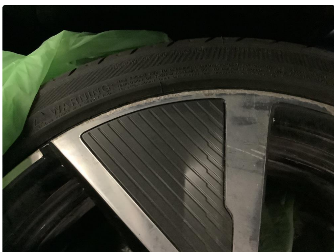
1.2 Noen bruksmerker på felg