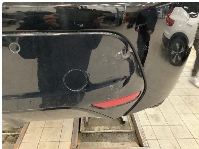
1.1 Liten ripe