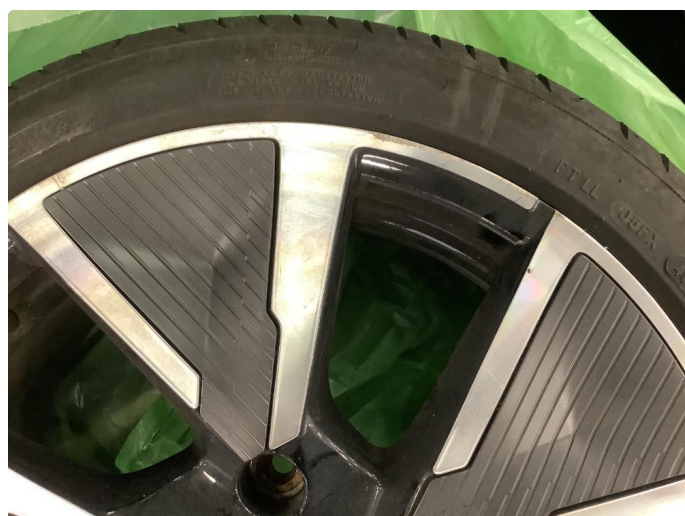
1.2 Noen bruksmerker på felg