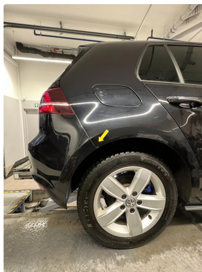
1.1 Korrosjon hjulbuer begge sider bak.