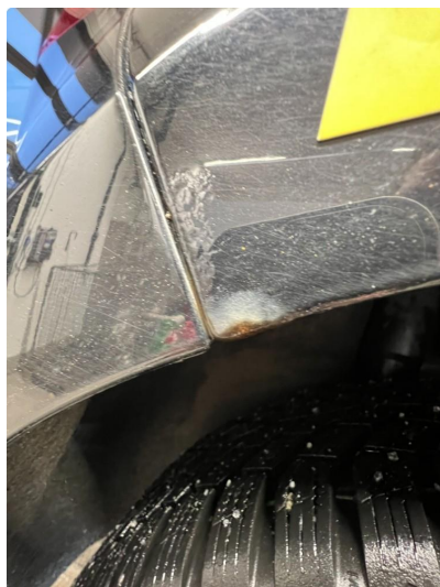
1.1 Korrosjon hjulbuer begge sider bak.