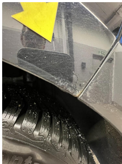
1.1 Korrosjon hjulbuer begge sider bak.