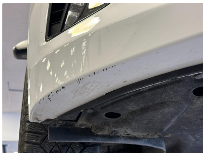
1.2 Skrubbskader underkant