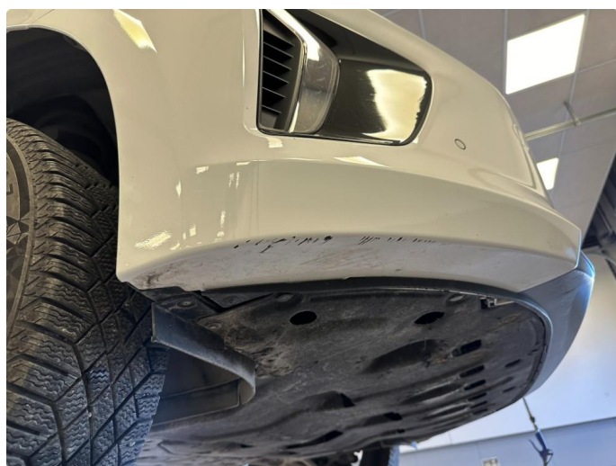
1.2 Skrubbskader underkant