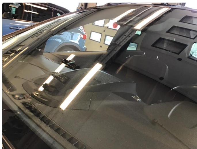
1.6 Sliteriper i synsfelt