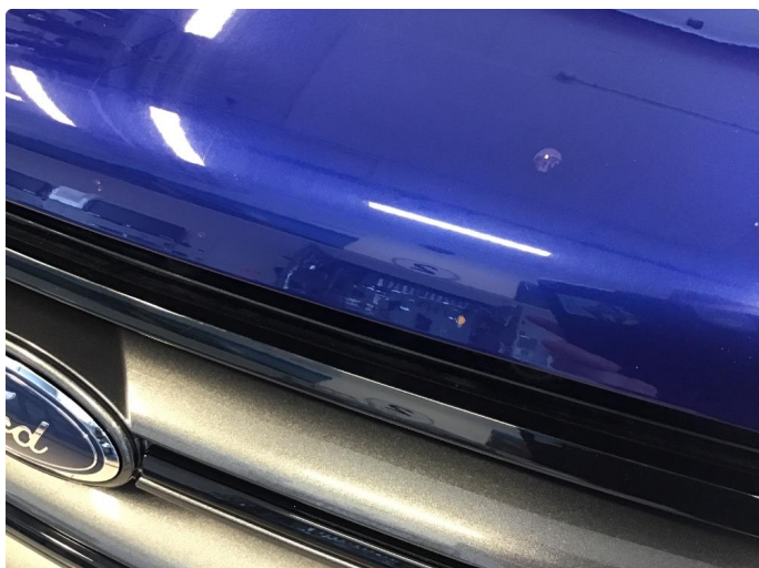
1.1 Noe steinsprut på panser