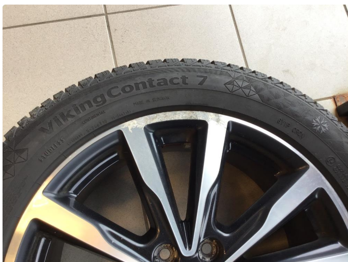
1.3 Påbegynnende oksidering