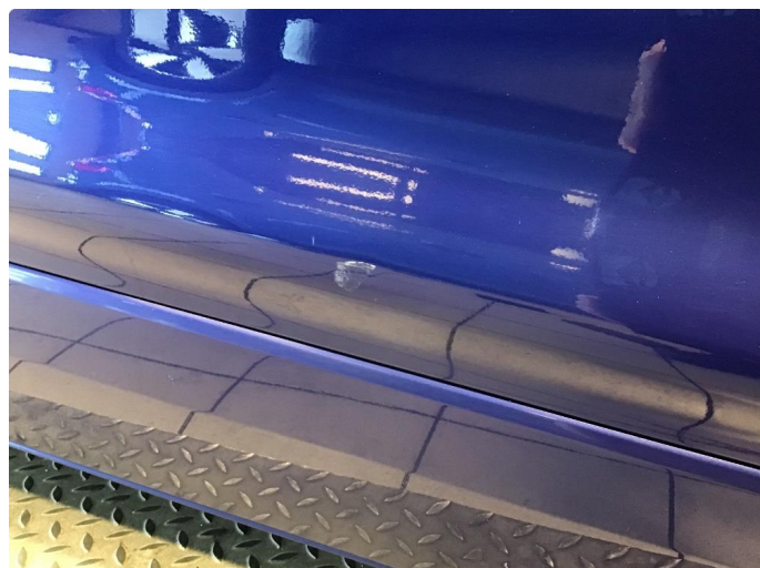
1.2 Riper forsøkt polert bort