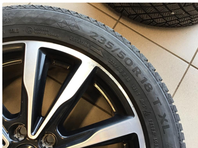
1.3 Påbegynnende oksidering