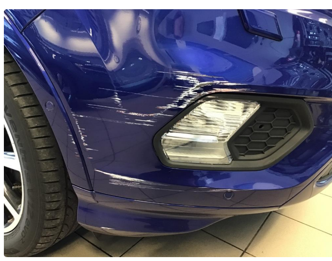
1.4 Skade polert bort