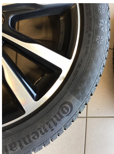
1.3 Påbegynnende oksidering