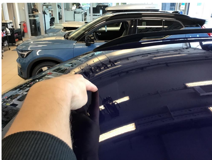
1.5 Små bulker etter steinsprut