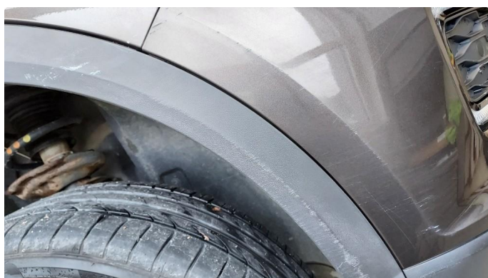
1.4 Noe riper i fanger foran