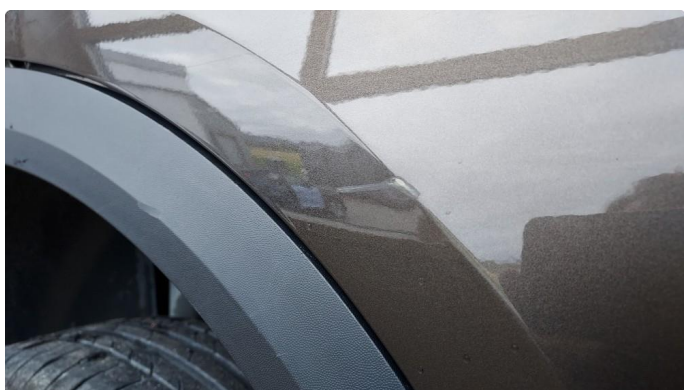
1.1 Lita ripe på dør høyre bak