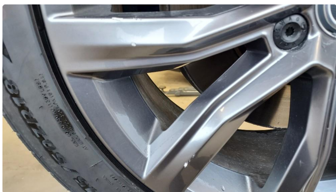
1.3 En sommerfelg litt kantkjørt