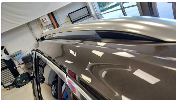
1.5 Liten bulk på tak-kant venstre side