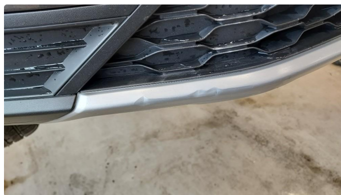
1.4 Noe riper i fanger foran