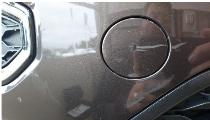
1.4 Noe riper i fanger foran