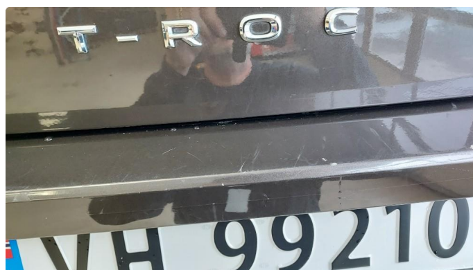
1.2 Noe riper i overkant bakluke + noen riper i lastesone fanger bak