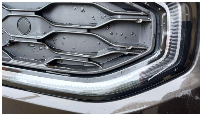
1.4 Noe riper i fanger foran