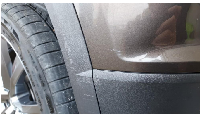
1.4 Noe riper i fanger foran