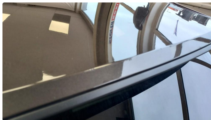
1.2 Noe riper i overkant bakluke + noen riper i lastesone fanger bak