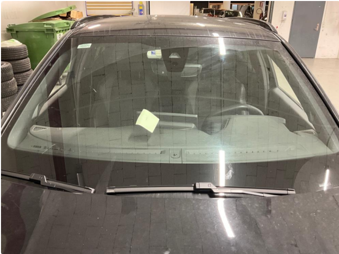
1.1 Steinsprutskade frontrute h. side. Denne er reparert.