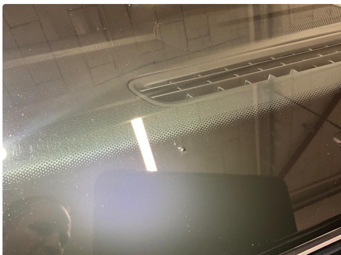
1.1 Steinsprut i nedkant frontrute, denne er reparert.