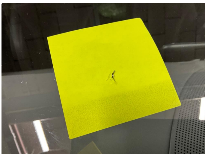
1.2 Steinsprut frontrute h. side. Disse er reparert.