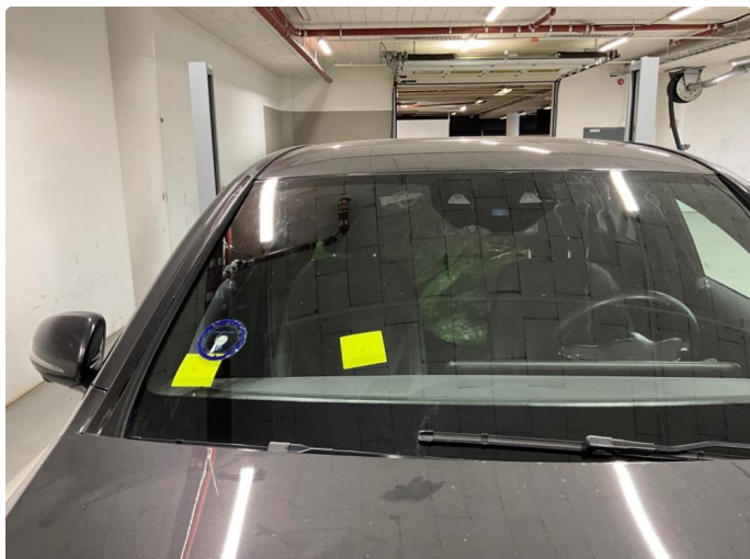
1.2 Steinsprut frontrute h. side. Disse er reparert.