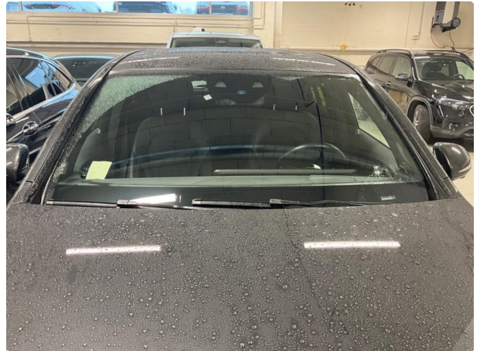
1.1 Steinsprut skade nede h. hjørne frontrute, denne er reparert.