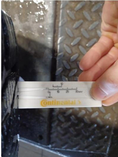
1.1 Øvrig opplysninger