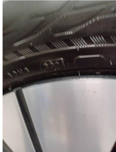
1.1 Øvrig opplysninger