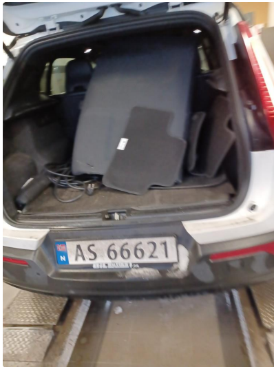
1.1 Øvrig opplysninger