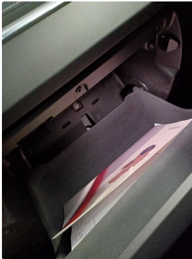
1.1 Dokumentert service, se bilde