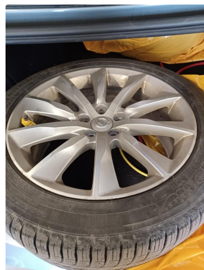
1.2 Øvrig opplysninger