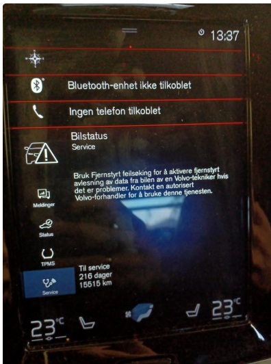
1.1 Dokumentert service, se bilde