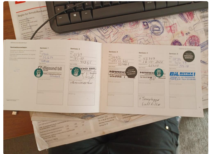
1.1 Dokumentert service, se bilde