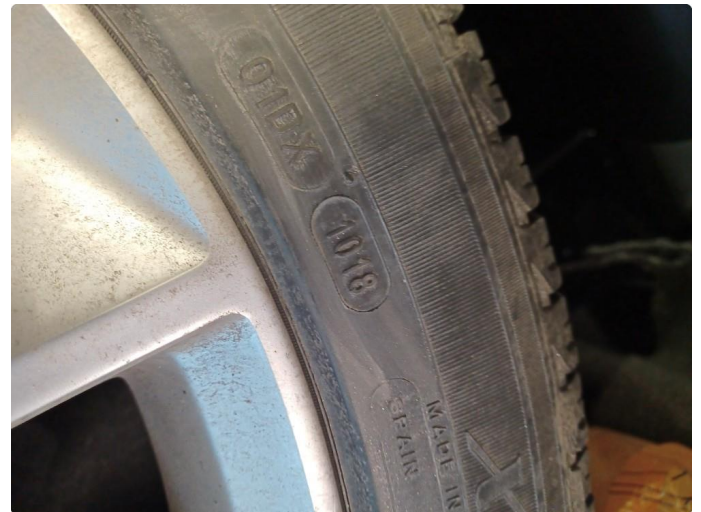
1.2 Øvrig opplysninger