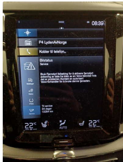
1.2 Dokumentert service, se bilde